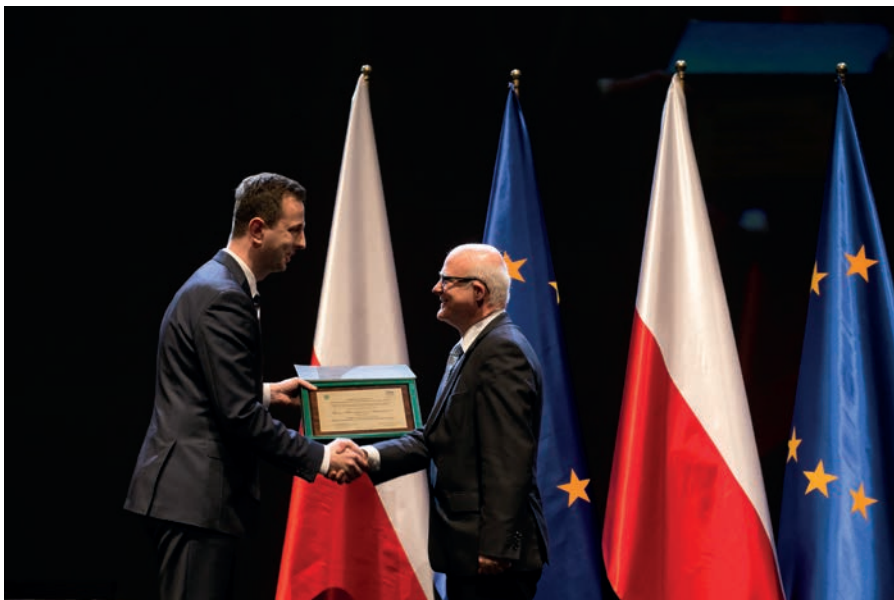
Wielka Osobowość Uniwersytetów Trzeciego Wieku Mieczysław Augustyn Senator RP, dyplom wręcza Władysław Kosiniak Kamysz Minister Pracy i Polityki Społecznej

przez Senat roku 2012 Rokiem Uniwersytetów Trzeciego Wieku oraz udział w przygotowaniach do I Kongresu UTW.